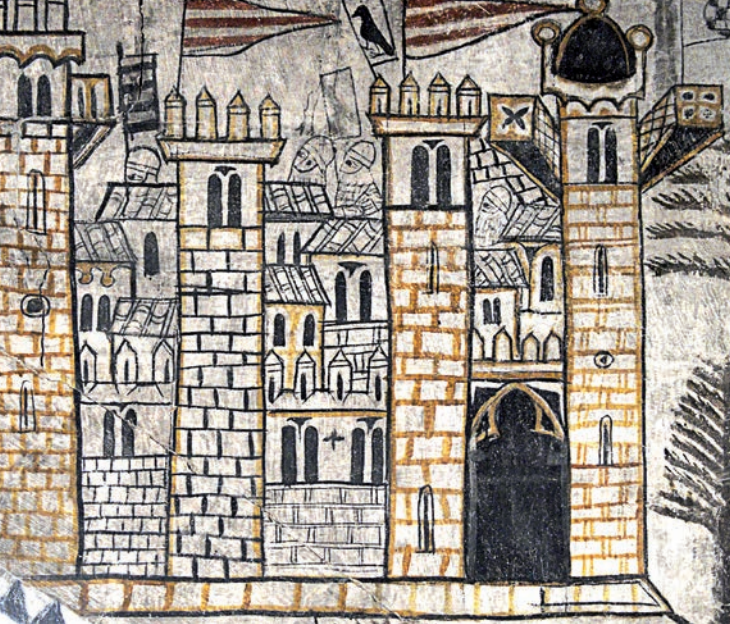
Pinturas del Castillo de Alcañiz