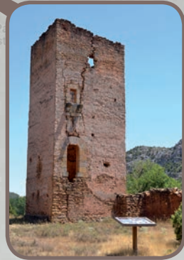
Torre Piquer (Berge)