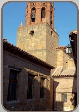
Castillo de Calanda