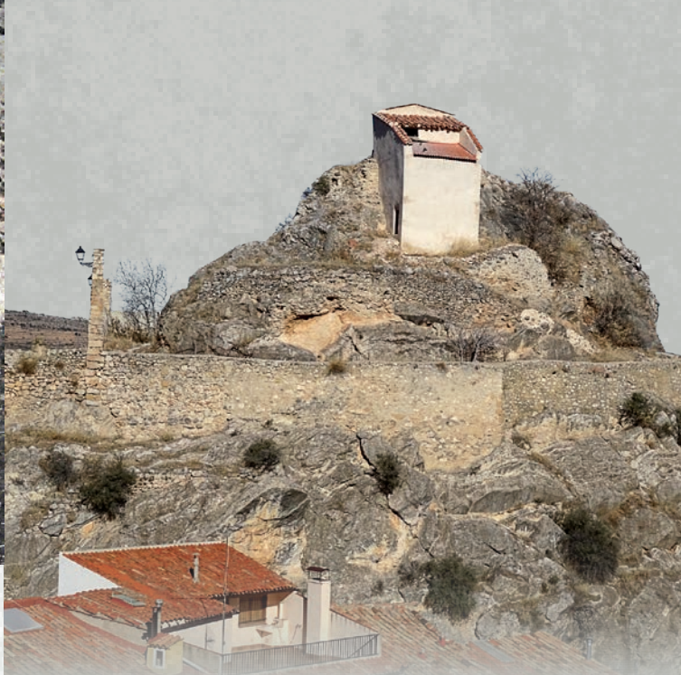
Peña del Castillo (Molinos).