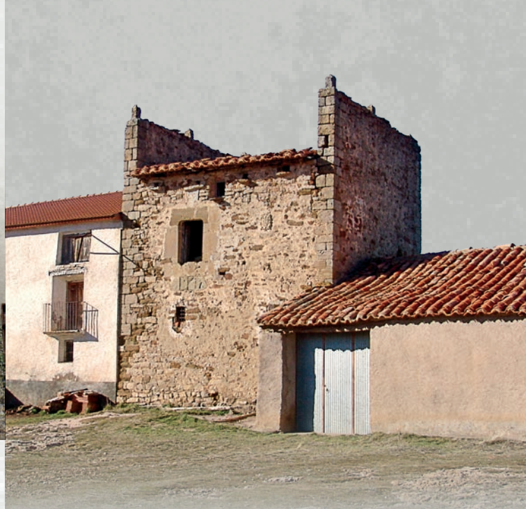
Torre Piquer (Villarroya de los Pinares).