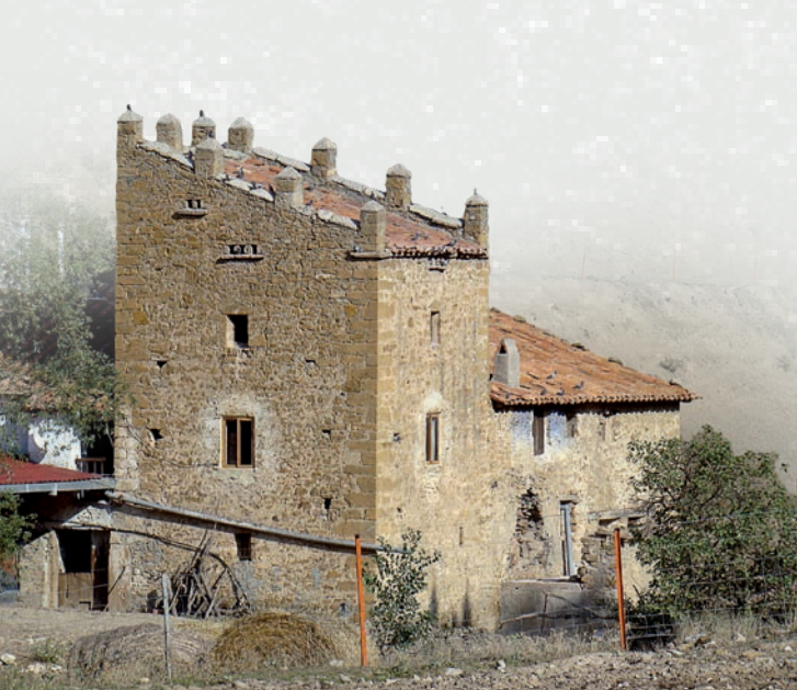
Torre del Peral (Aliaga).